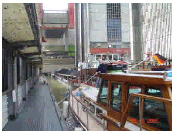
Schiffshebeverk Scharnebeck ved Lüneburg, en koncentreret matros i arbejde.