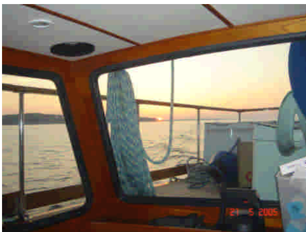
Solnedgang over Kerteminde bugt.

Så sker det. Fortøjningerne bliver smidt kl.18.20 og vi tøffer ud af Odense kanal i flot solskin. Trætheden efter de sidste ugers forberedelser og mange afskeder forsvinder for en stund og bliver afløst af en blanding af ro og spænding. Der står kasser overalt og forkahytten fungerer som et stort pulterrum. Vi måtte simpelthen opgive at stuve tingene af vejen efterhånden, som vi fik dem ombord. Det tog for lang tid og vi gik nærmest i selvsving. Hvordan pokker pakker man til et helt år? Vores første plan er at gå til Kerteminde, så er vi da i det mindste på vej! Men eftersom vejret ikke skulle blive for godt i næste uge, vælger vi at fortsætte til Lundeberg. Fuldmånen lyser for os som en god ven og vi har en rigtig flot start på vores tur.