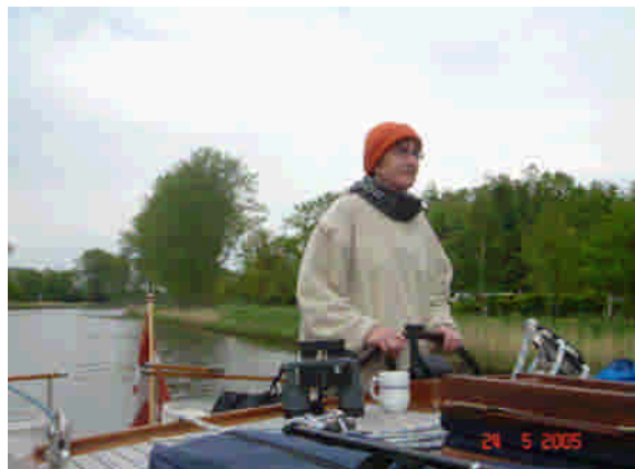
Den første sluse og mor ved rattet.